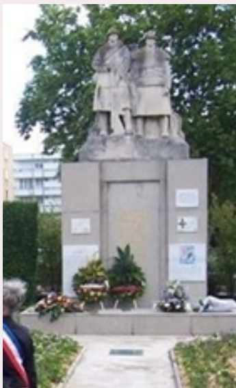
Le Monument aux Morts d'Oran en partie déplacé en 1968 à la Duchère à Lyon, lieu de la cérémonie annuelle d'Hommage National aux Harkis chaque 25 septembre.

En 1967, il quitte l'armée pour raisons de santé et consacre sa vie à la défense des soldats de l'armée d'Afrique et des Harkis. Fondateur et président de l'Union Nationale des Anciens Combattants Français-Musulmans (UNACFM) jusqu'en 2003, il obtient la reconnaissance de leurs droits et statuts. Très engagé dans la vie associative lyonnaise, il œuvre pour la mémoire combattante et l'intégration de ses frères exilés en France métropolitaine et de leurs familles. En 2001, Promu au grade de Commandeur de la Légion d'honneur , il est décoré par le Président de la République Jacques Chirac aux Invalides le 25 septembre 2001.